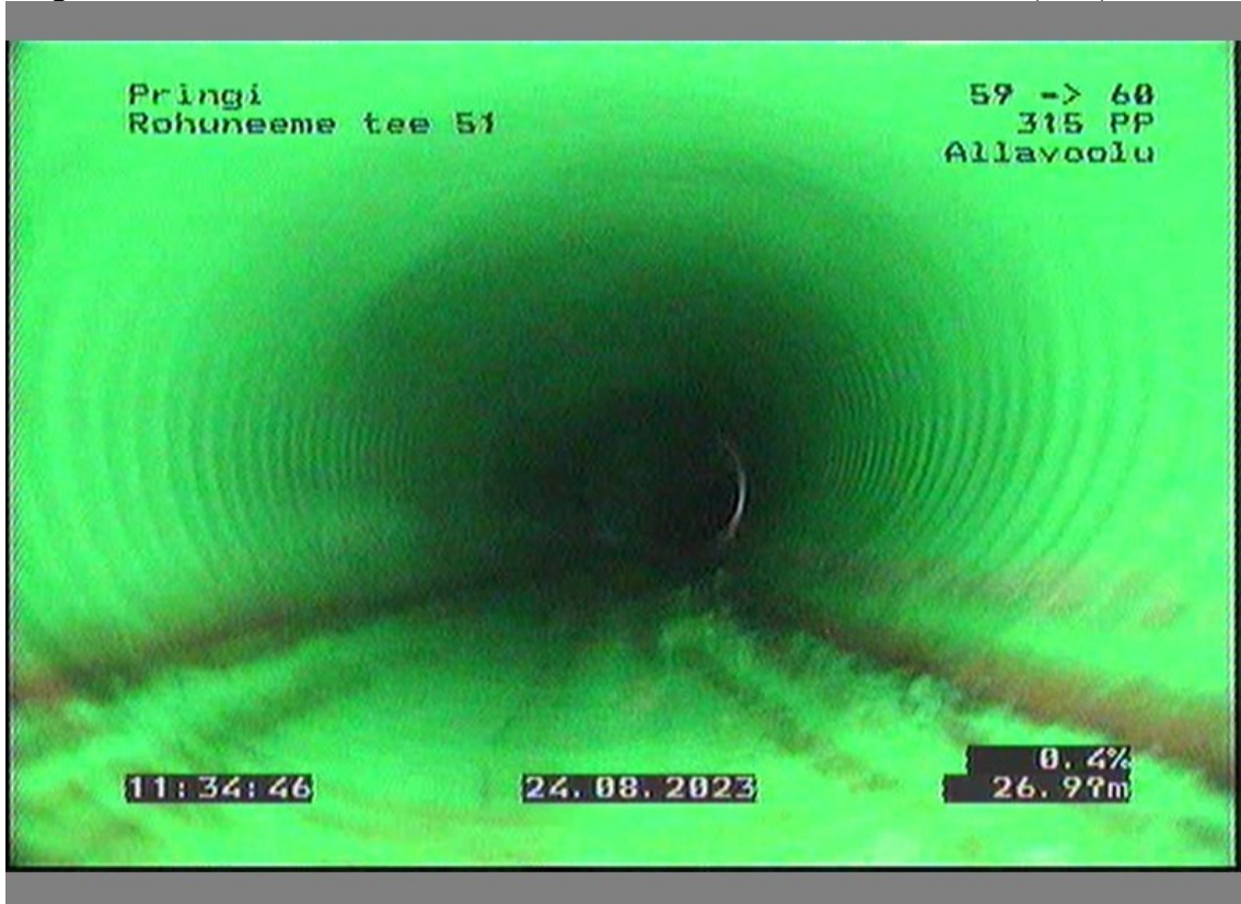
26.88m, Deformatsioon 12 - 12 , B Horisontaalne

Lõigus SK-2...SK-3 esineb nii vertikaalset, kui horisontaalset deformatsiooni (12%).